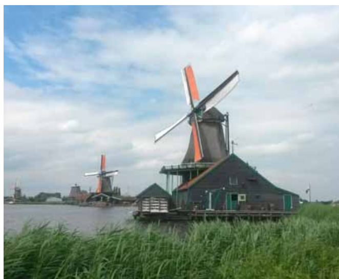
Mlin na veter