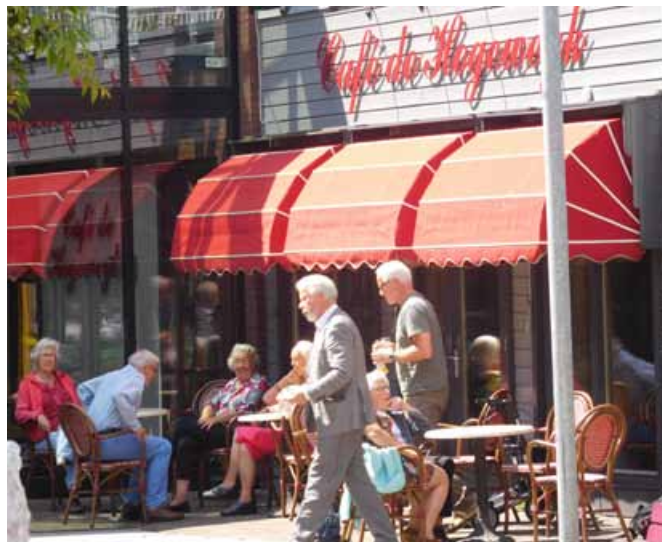
Kavana v Hogeweyku