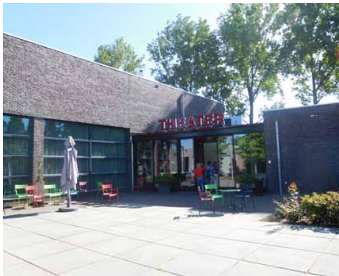
Gledališče v Hogeweyku