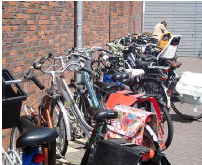
Osebe z demenco kolesarijo