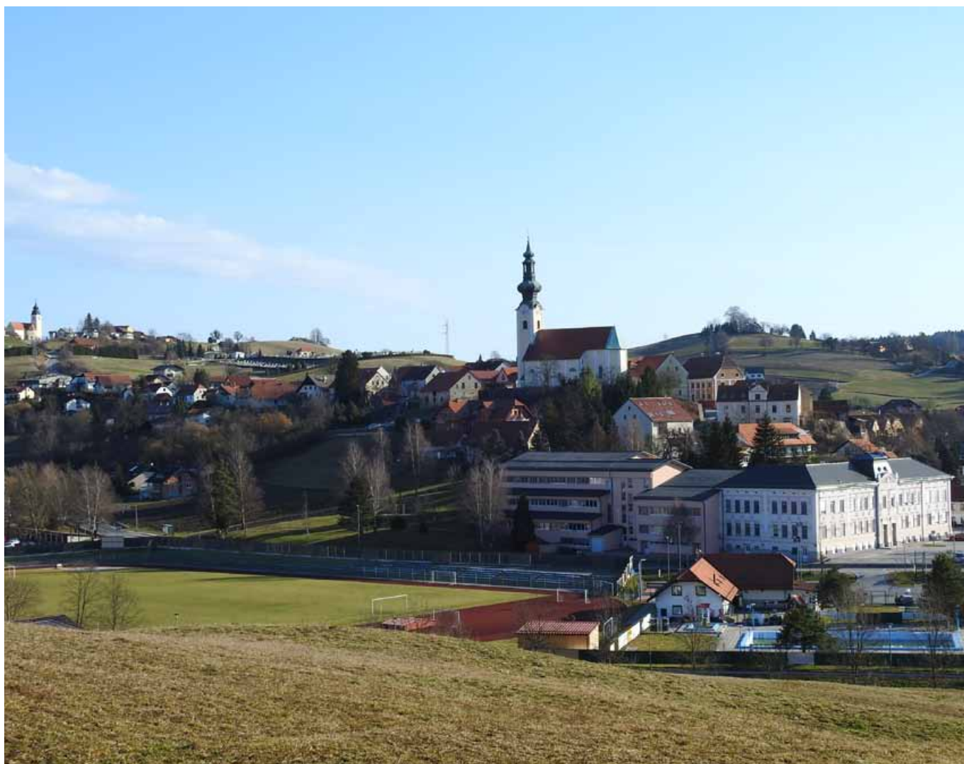
Šentjur, marec 2017

Mojca Stopar, predsednica Spominčice Šentjur