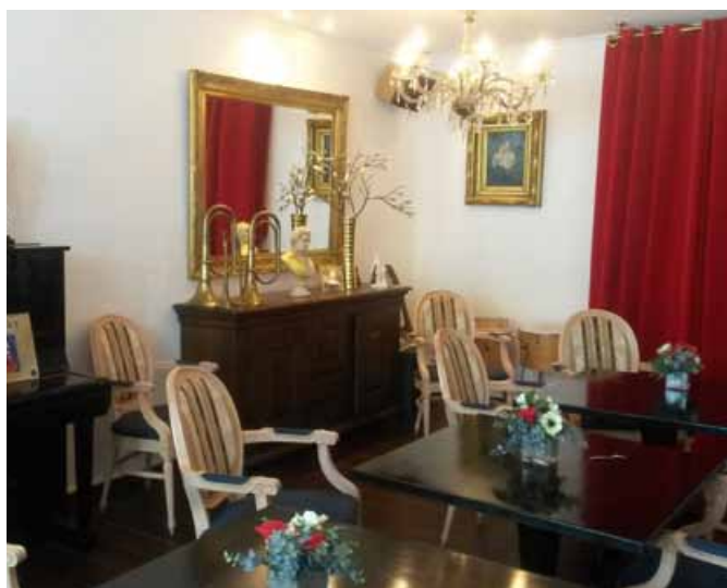
Glasbena soba v Hogeweyku